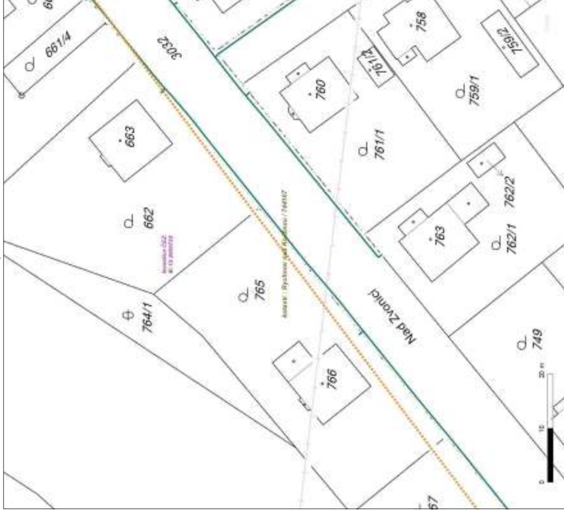
Situační výkres - list 5

Není-li zobrazena katastrální mapa, zadejte žádost znovu. Katastrální mapa je generována prostřednictvím externí WMS služby, jejíž provoz nezajišťuje společnost ČEZ Distribuce, a. s.