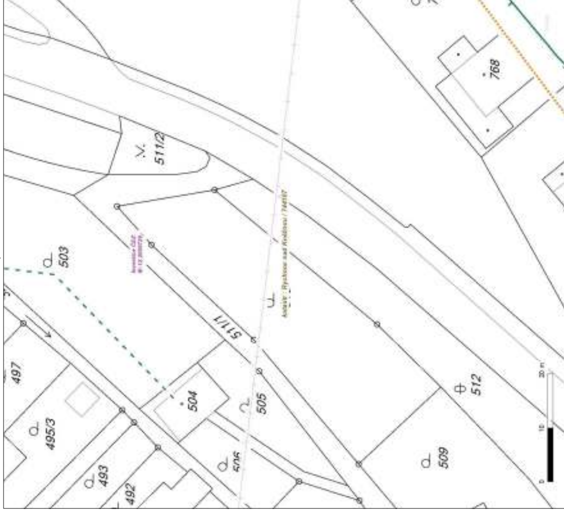
Situační výkres - list 4

Není-li zobrazena katastrální mapa, zadejte žádost znovu. Katastrální mapa je generována prostřednictvím externí WMS služby, jejíž provoz nezajišťuje společnost ČEZ Distribuce, a. s.